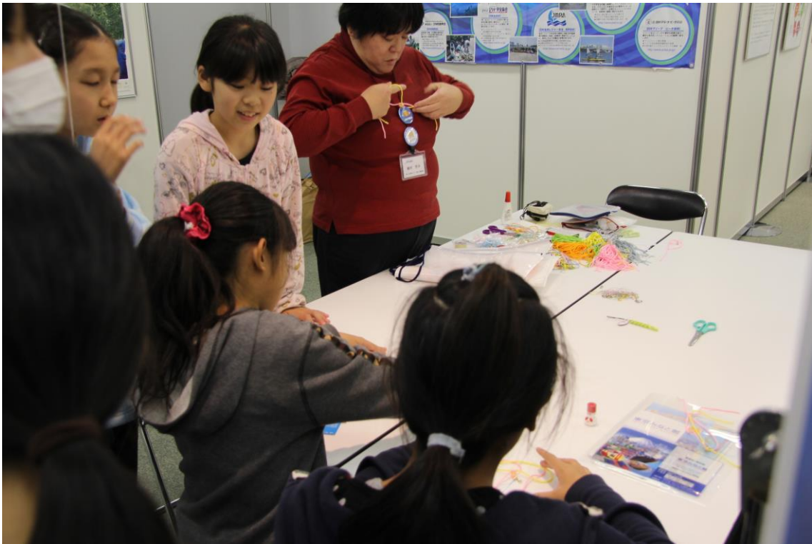
うみなでしこの指導による組みひも教室