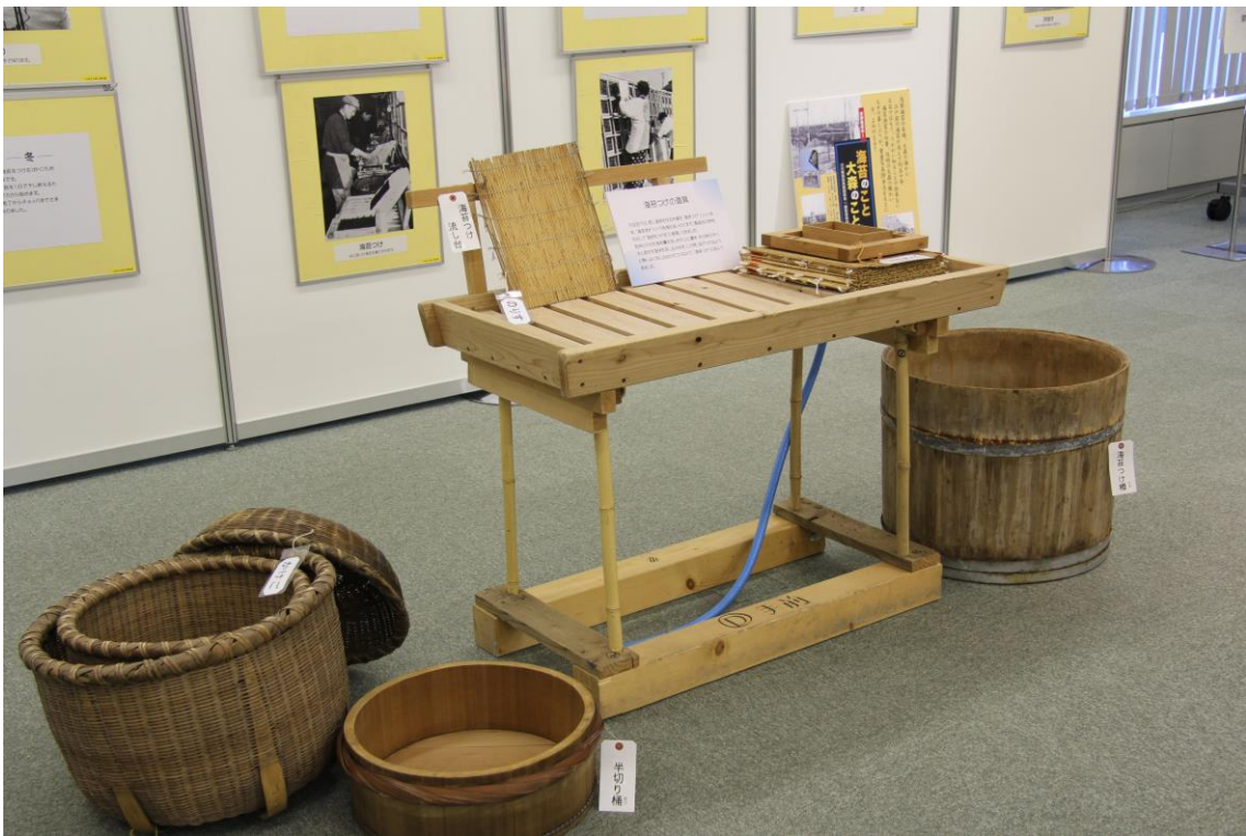
東京湾での伝統的な江戸前のりづくりの道具と記録写真