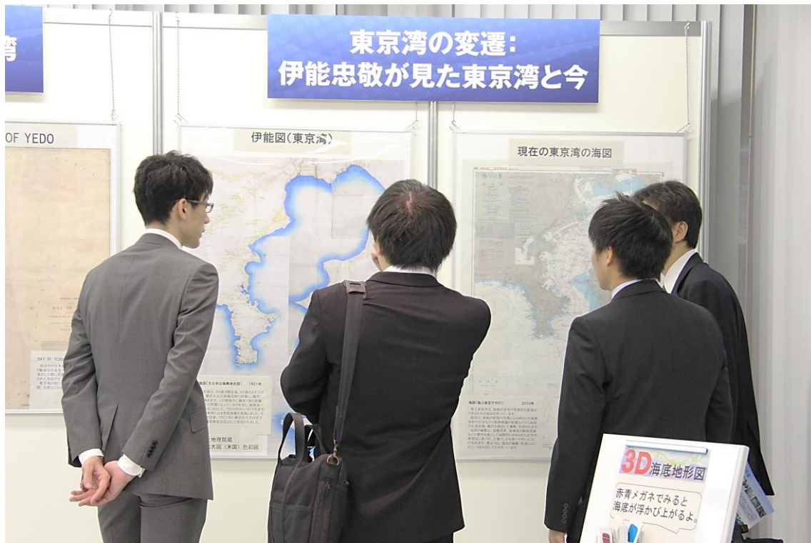
東京湾の古い地図から変遷を学ぶ