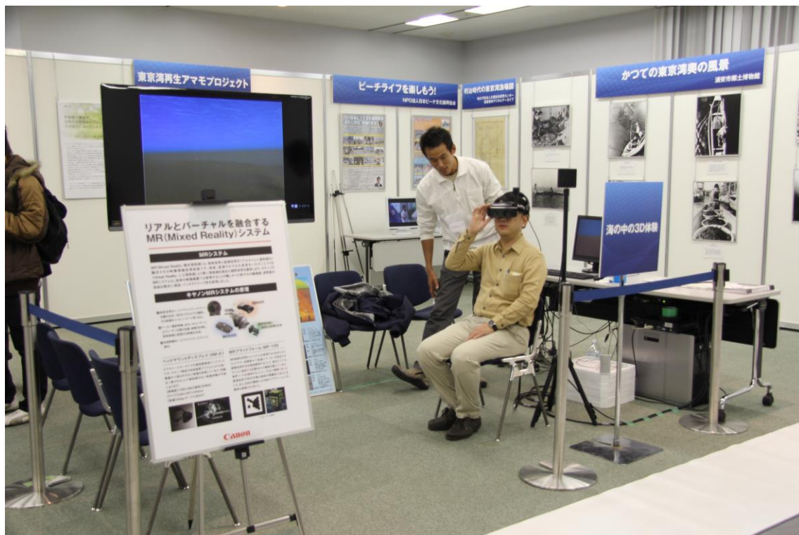
海の中の3次元（3D）体験