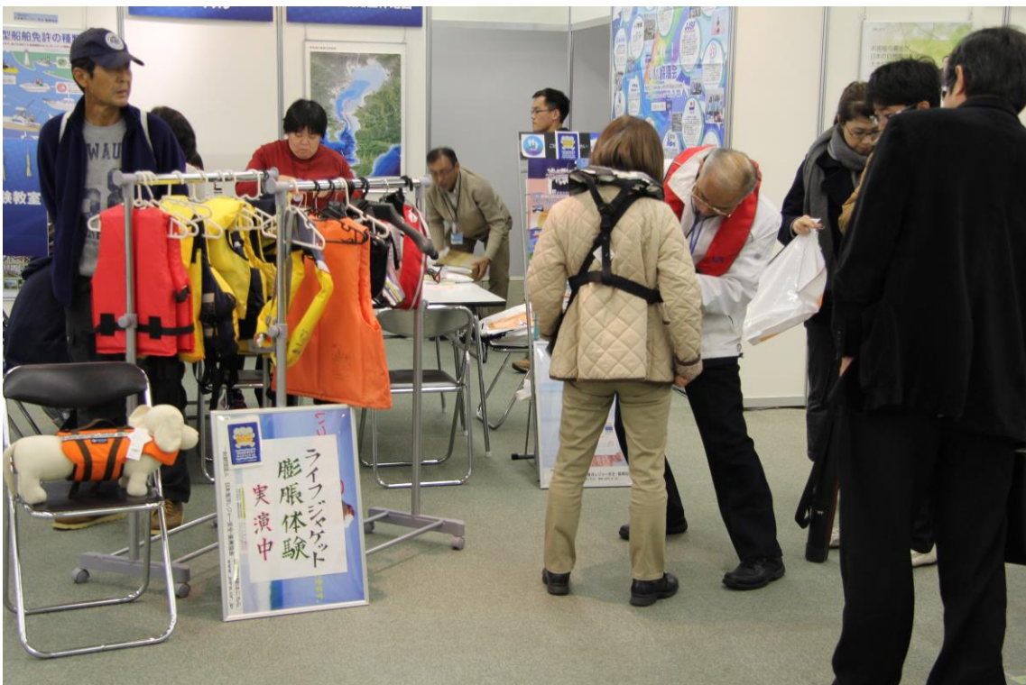
海で遊ぶ時の安全に関する展示