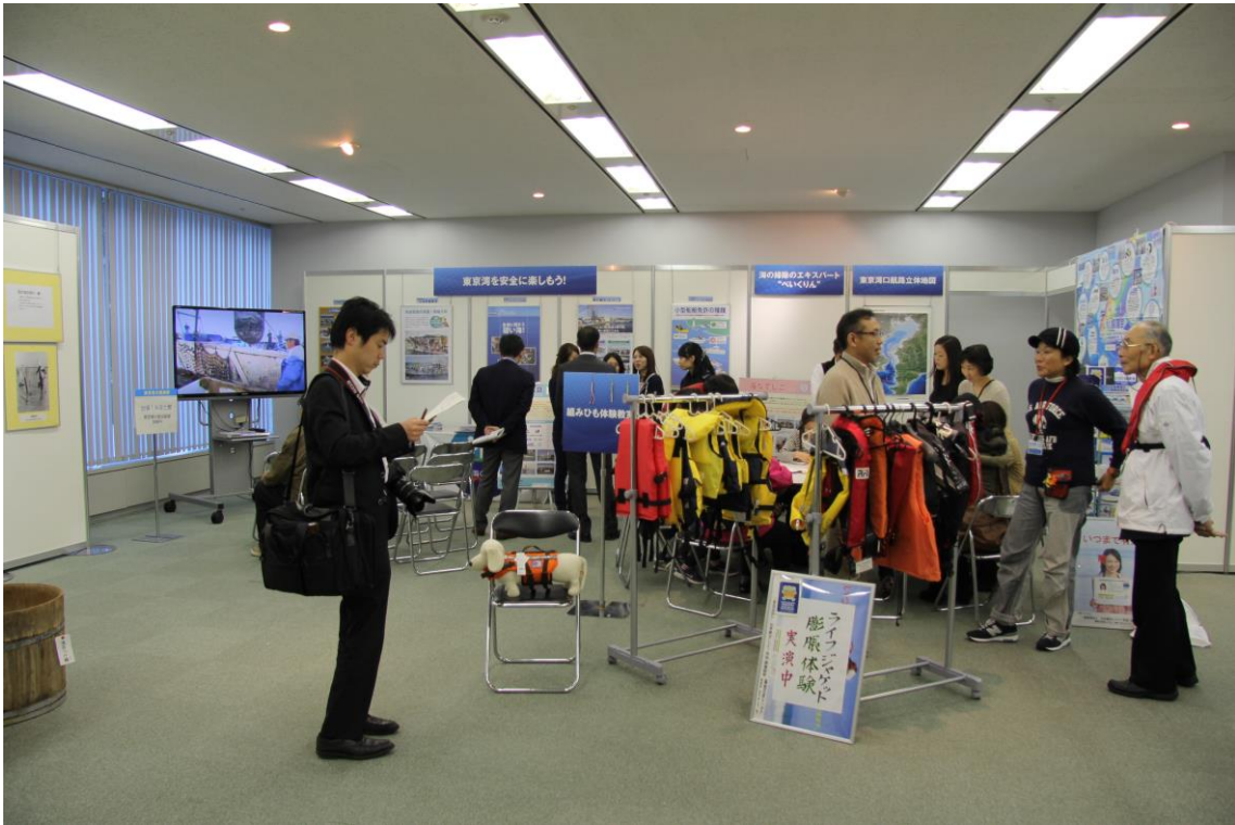
ホール3での展示の様子・東京湾の歴史の貴重な映像も放映